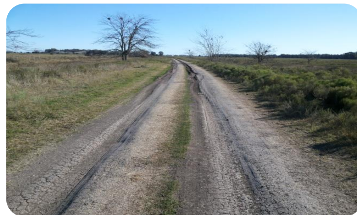
Zona No tratada